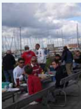
GrillHygge før Fur Rundt